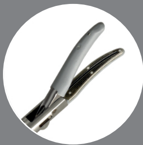
PINÇA CURVA MARYLAND

Conheça esta nova linha de instrumentais Bhio Supply, contate um de nossos revendedores e solicite maiores informações.