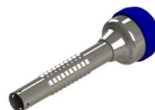
BAINHA DIAFRAGMA ROSQUEÁVEL 10MM, 5CM SEM VÁLVULA