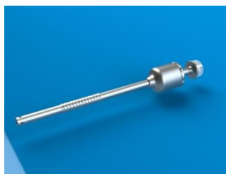
BAINHA JANELA ACIONAMENTO MANUAL SEM VÁLVULA

As Bainhas Sem Válvula Bhio Supply são fabricadas em Aço Inox AISI 303, Aço Inox AISI 304 e Silicone grau médico.