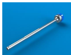
BAINHA DIAFRAGMA ROSQUEÁVEL SEM VÁLVULA