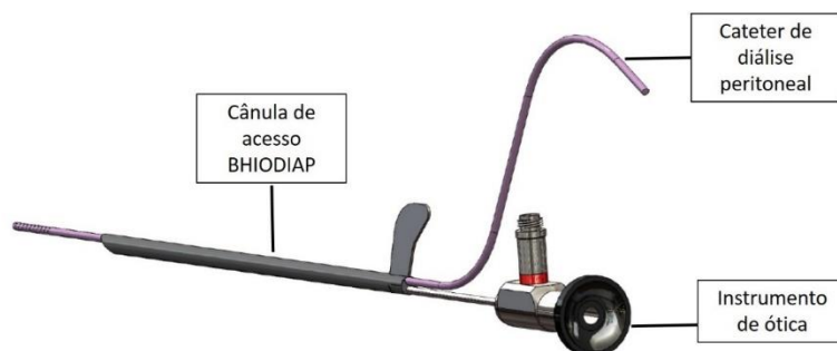
Figura: Imagens ilustrativa da Cânula de Acesso BHIODIAP com o cateter e o instrumento de ótica (etapa 7).

ATENÇÃO: Todo instrumento cirúrgico fornecido não estéril, deve ser limpo e esterilizado antes de ser usado pela primeira vez e após cada utilização.